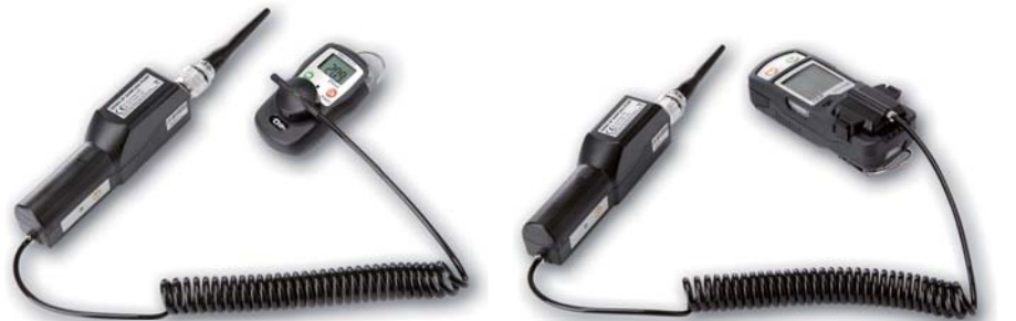
▲ 사용 예1